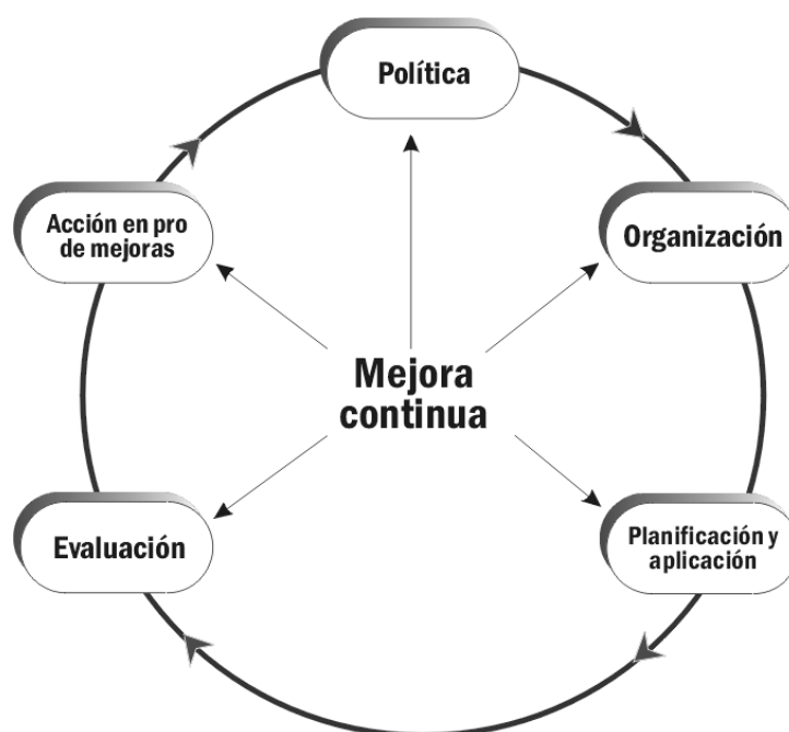
Figura 2. Principales elementos del sistema de gestión de la SST

La seguridad y la salud en el trabajo incluyendo el cumplimiento de los requerimientos de la SST conforme a las leyes y reglamentaciones nacionales son la responsabilidad y el deber del empleador. El empleador debería mostrar un liderazgo y compromiso firme con respecto a las actividades de SST en la organización , y debería adoptar las disposiciones necesarias para crear un sistema de gestión de la SST, que incluya los principales elementos de política, organización, planificación y aplicación, evaluación y acción en pro de mejoras, tal como se muestra en la figura 2: